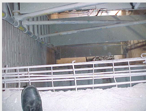
Bordes tijdens renovatie